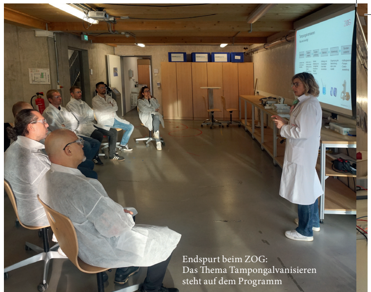
Endspurt beim ZOG: Das Thema Tampongalvanisieren steht auf dem Programm

tiert und uns anschließend erneut bittet, Laborkittel und weitere Schutzaccessoires anzuziehen. Jetzt gilt es, kleine Kunststofftierchen zu vergolden – Galvanoplastiken. Die Crux: Kunststoff ist nicht leitfähig und genau das ist bei der elektroytischen Galvanisierung entscheidend, um Schicht um Schicht mit Hilfe von elektrischem Strom abzuscheiden. Mit einem Silberlack beheben wir das Defizit und fahren dann wie gelernt fort. Bald erstrahlt mein ursprünglich matt dunkles Kunststoffschaf in gleißendem Gold. Nach weiteren theoretischen Lehrepisoden in Korrosion (jährlicher Schaden im dreistelligen Milliardenbereich, geschätzt 6 % des BIP!) sowie Mess- und Prüfmethoden schließen wir diesen anspruchsvollen Unterrichtstag ab.