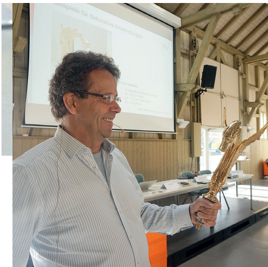
Vergoldeter Schwan: Mehrere Exponate wurden unter den Teilnehmern herumgereicht