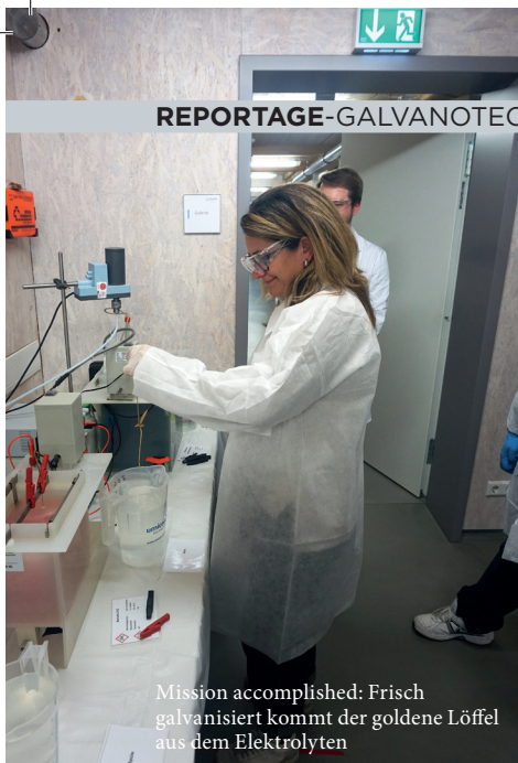
Mission accomplished: Frisch galvanisiert kommt der goldene Löffel aus dem Elektrolyten