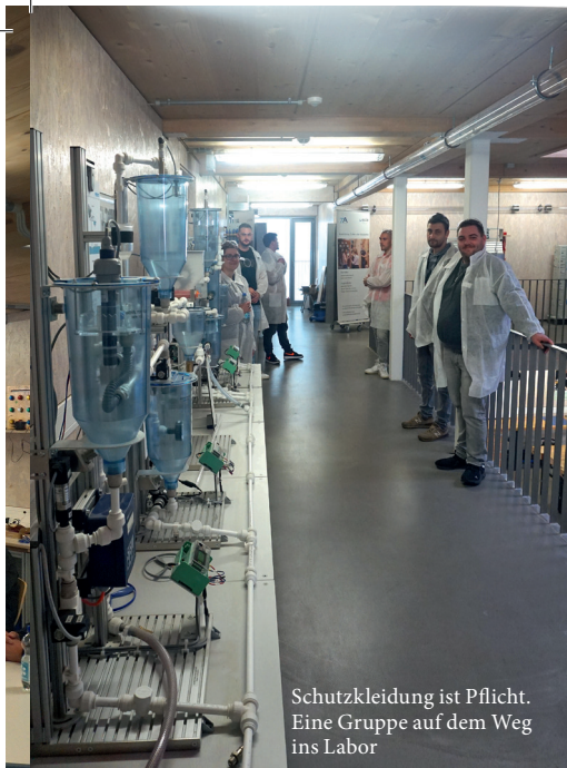
Schutzkleidung ist Pflicht. Eine Gruppe auf dem Weg ins Labor