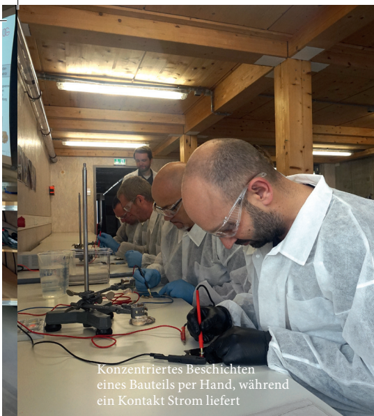
Konzentriertes Beschichten eines Bauteils per Hand, während ein Kontakt Strom liefert