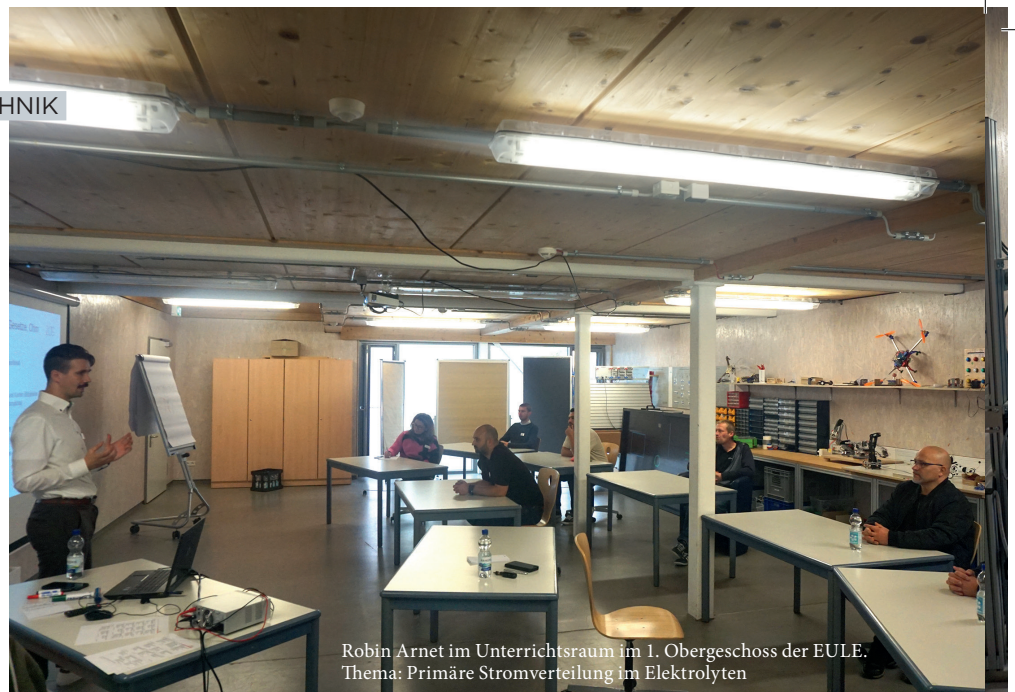
Robin Arnet im Unterrichtsraum im 1. Obergeschoss der EULE. Thema: Primäre Stromverteilung im Elektrolyten

löffel wird gespült, dekapiert und landet dann im Gold-elektrolyten. Schließlich halten wir das gute Stück in der Hand, das uns zum ersten Mal das Gefühl gibt, Nachwuchs-galvaniker zu sein.