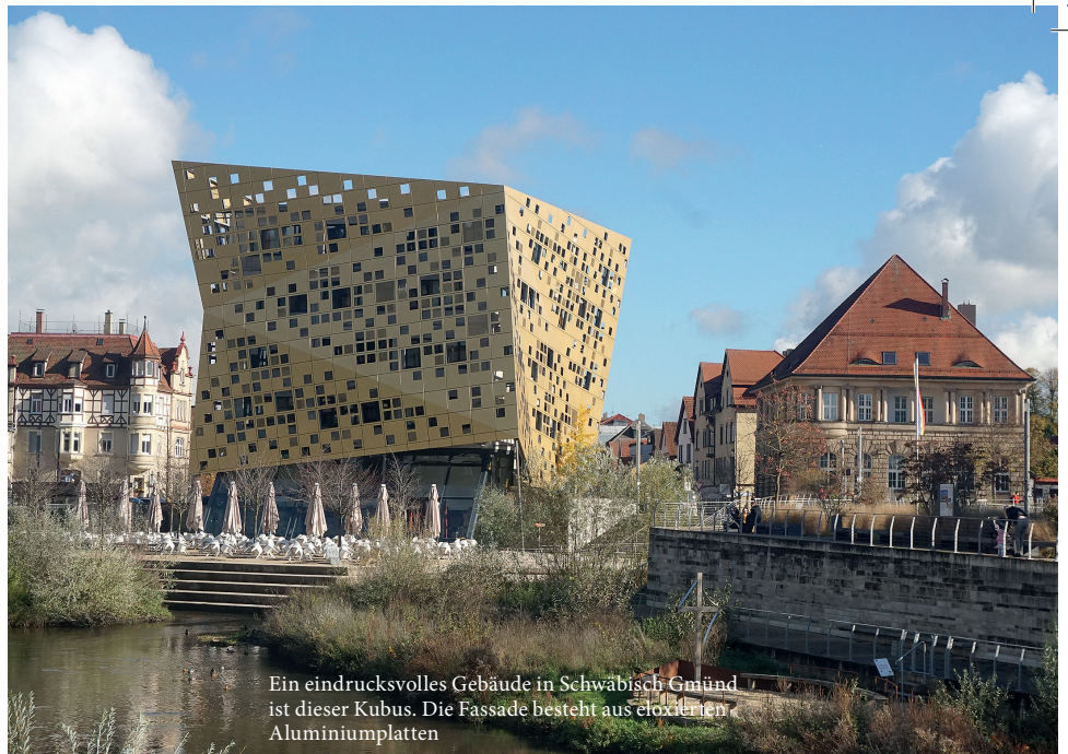
Ein eindrucksvolles Gebäude in Schwäbisch Gmünd ist dieser Kubus. Die Fassade besteht aus eloxierten Aluminiumplatten