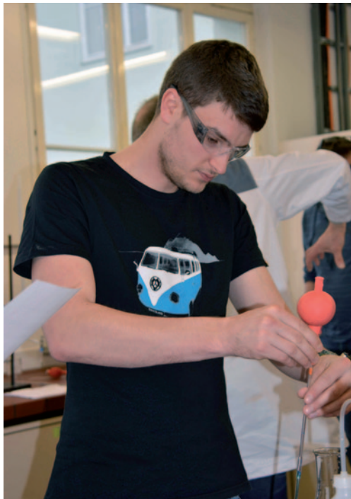
Abb. 3: Der Umgang mit Laborgeräten wird geübt

Teilnehmer einig, dass Konzentrationen in Elektrolyten schnell mit klassischen, nasschemischen Verfahren bestimmt werden können. Für die Bestimmung von Stoffen z. B. in Abwasserproben sollten, aufgrund der geringen Konzentrationen, einfache instrumentelle Verfahren (z. B. vorbereitete Küvettentests) herangezogen werden.