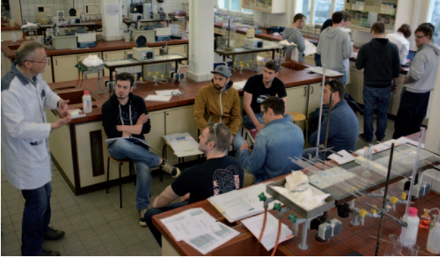
Abb. 2: Vorbereitung der Laborarbeit

Beersche Gesetz, bei dem die Konzentration eines Stoffes in einer Probe proportional zur Extinktion (= Lichtschwächung) bei einer vorgegebenen Wellenlänge ist. Oder bei der komplexometrischen Titration. Hier ist das Ergebnis direkt proportional zur Konzentration der eingesetzten Maßlösung (= Titrierlösung). An dieser Stelle unterliegen viele Analytiker dem Irrtum, dass sie richtig gearbeitet haben. Eine ganze Reihe von Fehlermöglichkeiten lauern auf dem Weg von der Probenahme bis zum Ergebnis. Die Analytik, erweitert durch statistische Methoden, gibt hier Hilfestellung, Fehler zu erkennen und einzugrenzen, jedoch nicht auszuschließen. In Tabelle 4 sind Definitionen und Fehlermöglichkeiten zusammengefasst. Nach Durchführung von Analysen an Elektrolytlösungen und Abwasserproben mit nasschemischen