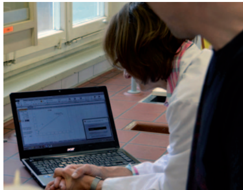
Abb. 4: Auswertung der Ergebnisse vor Ort

Teilnehmer einig, dass Konzentrationen in Elektrolyten schnell mit klassischen, nasschemischen Verfahren bestimmt werden können. Für die Bestimmung von Stoffen z. B. in Abwasserproben sollten, aufgrund der geringen Konzentrationen, einfache instrumentelle Verfahren (z. B. vorbereitete Küvettentests) herangezogen werden.